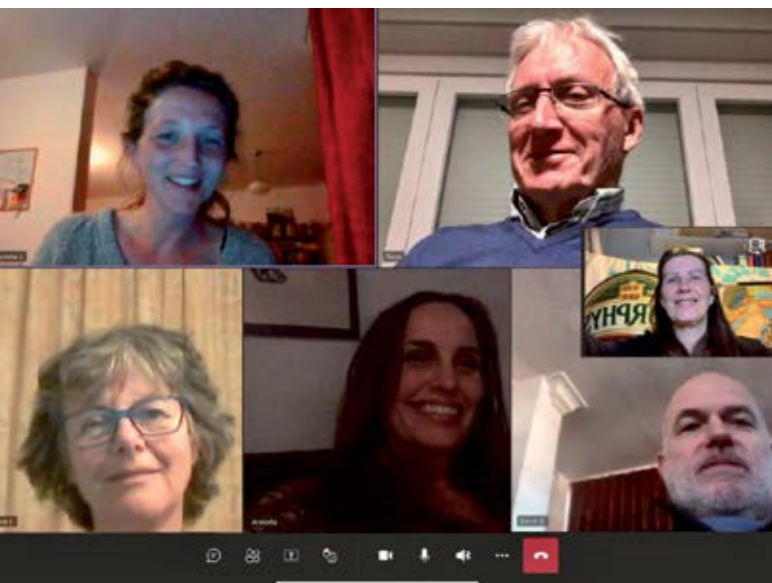
Foto: Caring Vets bestuur, online vergaderen, zoals zovelen dit jaar!

In april 2020 zijn we lid geworden van de Eurogroup for Animals, een organisatie die de krachten bundelt op het gebied van dierenwelzijn op Europees niveau. Hiermee